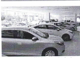
Problema atinge cerca de 30% das empresas de todo país

A Prefeitura Municipal de Barra faz saber aos interessados que, para o processo de licitação nº 014/2020, para a contratação de prestação de serviços de limpeza e conservação de áreas públicas, a licitação será realizada em 27 de outubro de 2020, às 14h30min, no local a seguir informado.